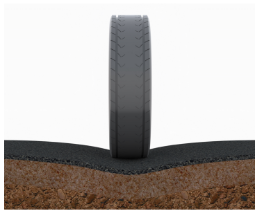
Ilman suodatinkangasta maa-ainekset sekoittuvat ja painuvat.