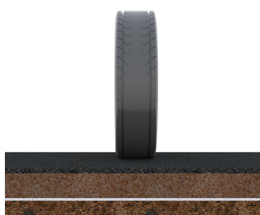
Suodatinkangas tukee erotettuja maa-aineksiä.